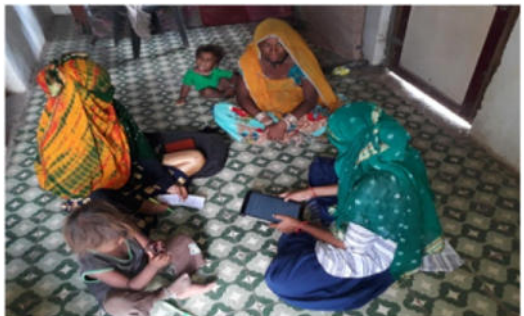
સ્માર્ટ ફોનના વિકલ્પે ટેબલેટ દ્વારા બાળકોને જૂથમાં શિક્ષણ પ્રવૃત્તિ