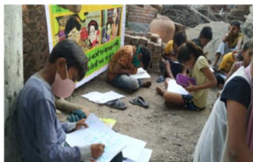
चार्ल्स हेल्प लाईन - १०६८ (२४ x ७ ) नो बाणको तथा वालीओ साथै घर आंगणो प्रचार - प्रसार - प्रवृत्ति