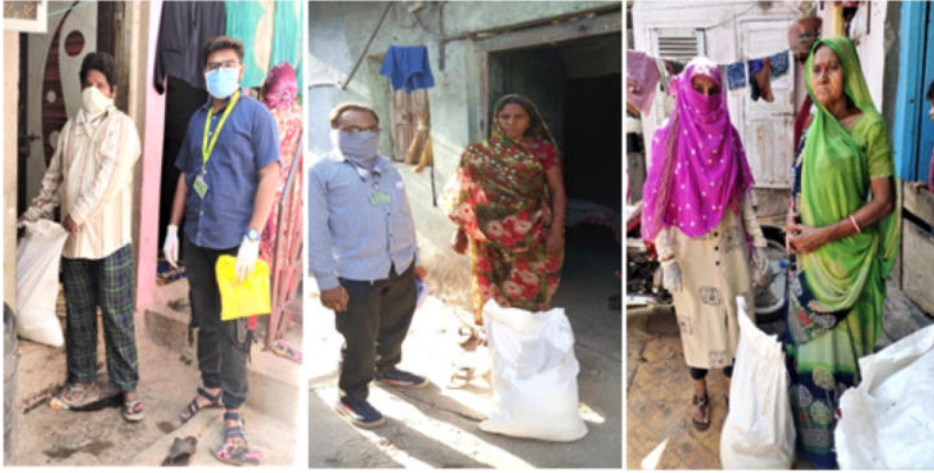
કોરોના કાળમાં જરૂરીયાત વાળા કુટુંબોને રાશન કિટનું વિતરણ