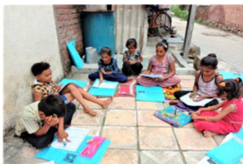
बाणको द्वारा शैक्षिक किटनी प्रवृत्ति