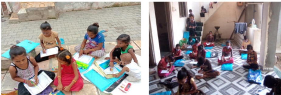
બાળકો સાથે નાના નાના જૂથમાં શૈક્ષણિક પ્રવૃત્તિ કિટ દ્વારા ઘર આંગણે પ્રવૃત્તિઓ