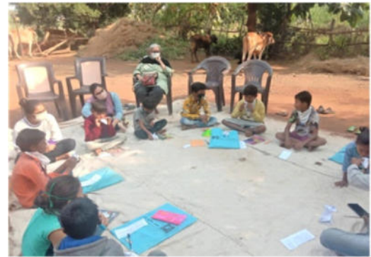
વાલીઓ અને બાળકો સાથે વિસ્તારોમાં મીટિંગ