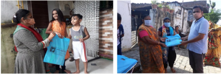
કોરોના કાળમાં બાળકો જાતે ઘરે પ્રવૃત્તિ દ્વારા અર્થપૂર્ણ સમય વ્યતીત કરે તે માટે શૈક્ષણિક પ્રવૃત્તિ કિટ નું વિતરણ